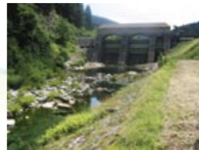
Stauwehr mit Ausleitungsstrecke (Murg)

Durch die Querverbauungen der Wasserkraftanlagen geht die biologische Durchgängigkeit der Gewässer verloren. Auf Wanderungen angewiesene Tiere können ihre Nahrungs-, Laich-, Ruhe- oder Rückzugsgebiete nicht mehr erreichen. Aufstiegsanlagen können diese Beeinträchtigungen nur zum Teil ausgleichen. Die Lebensgemeinschaften im Gewässer werden isoliert. Der genetische Austausch wird unterbrochen. Verluste können nicht mehr durch Zuwanderung ausgeglichen werden.