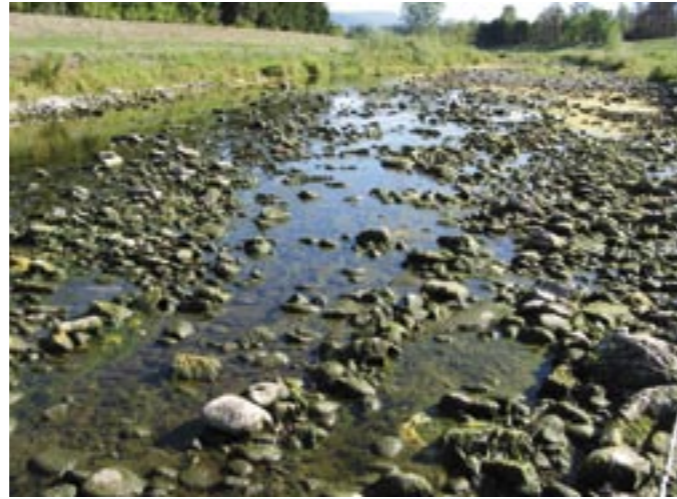
Trocken gefallene Ausleitungsstrecke

Ausleitungsstrecken fallen trocken, die Kiesbänke oberhalb der Wehre sind mit Schlamm überzogen, die Temperaturen steigen und die Strömung von einst sucht der Fisch in zahlreichen und langen Stauräumen vergebens.