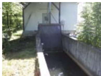
Triebwerkskanal und Rechen (Elz)

Die zum Teil kilometerlangen Triebwerkskanäle sind als Lebensraum nicht geeignet.