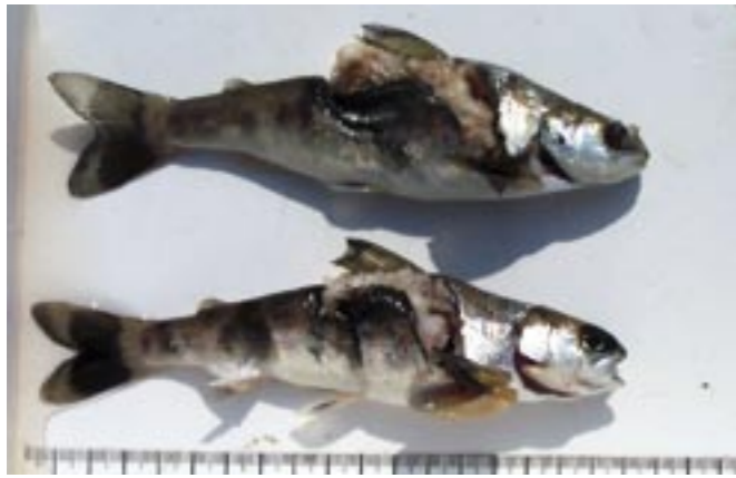
Bei der Abwanderung durch die Turbine getötete Junglachse

Die typischen Fischarten unserer fließenden Gewässer, wie beispielsweise Lachs, Stör, Streber und Strömer zählen zu den am stärksten gefährdeten Wirbeltieren. Selbst der Bau von Fischaufstiegsanlagen nach dem heutigen Stand der Technik ermöglicht oft nur einem Teil der Fische die ansonsten unmögliche Stromaufwärtswanderung, da sie für die Fische in vielen Fällen sehr schwer auffindbar sind. Bei der Stromabwärtswanderung sind die Turbinen ein tödliches Risiko.