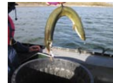
Von Turbine zerhackter Aal (Rhein)

Unterhalb der Entnahmestelle fehlt das Wasser im Bach. Der Lebensraum für Tiere und Pflanzen geht verloren.